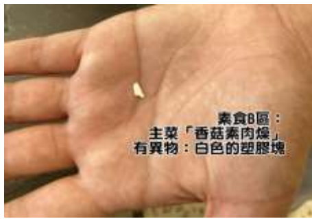
9/7(一) 素食B區：主菜「香菇素肉燥」有異物「白色的塑膠塊」。