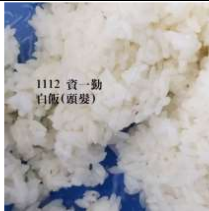
11/12(四) 資一勤 白飯 發現異物「頭髮」。