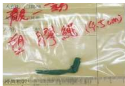
10/26(一) 觀一勤 主菜:茄汁肉柳 發現異物「4.5 公分綠色塑膠繩」。