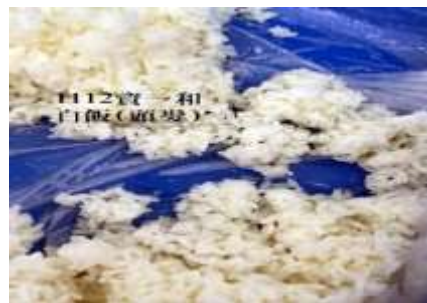
11/12(四) 資一和 白飯 發現異物「頭髮」。