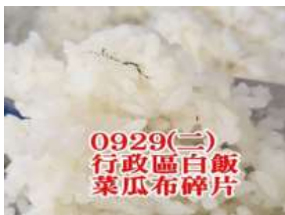
9/29(二) 行政區 白飯 發現異物「菜瓜布碎片」。