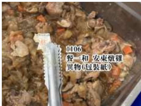
11/6(五) 餐一和 主菜:安東燉雞 發現 異物「合格包裝貼紙」。