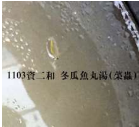
11/3(二) 資二和 湯品:冬瓜魚丸湯 發現異物 「菜蟲」。