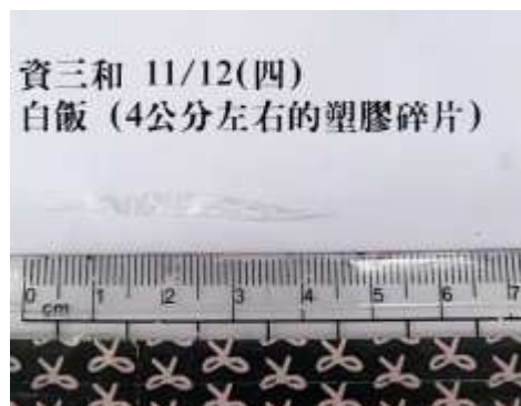
11/12(四) 資三和 白飯 發現異物「塑膠碎片」。