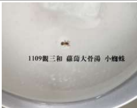
11/9(一) 觀三和 湯品:蘿蔔大骨湯 發 現異物「小蜘蛛」。