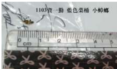
11/3(二) 資一勤 裝菜的藍色桶子 發現異物「小 蟑螂」。