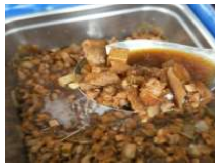
10/23(五) 觀三和主菜：香菇肉燥 發現「約 14 公分的塑膠繩」