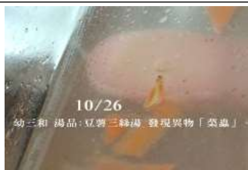
10/26(一) 幼三和 湯品:豆薯三絲湯 發現異物「菜蟲」。