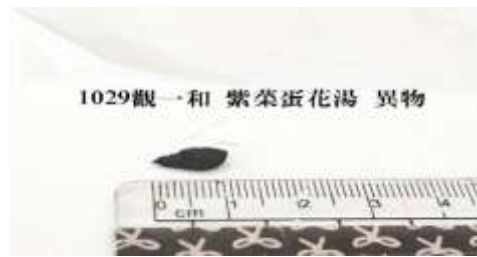
10/29(四) 觀一和 湯品:紫菜蛋花湯 發現異物「1.3 公分的黑色物體」。